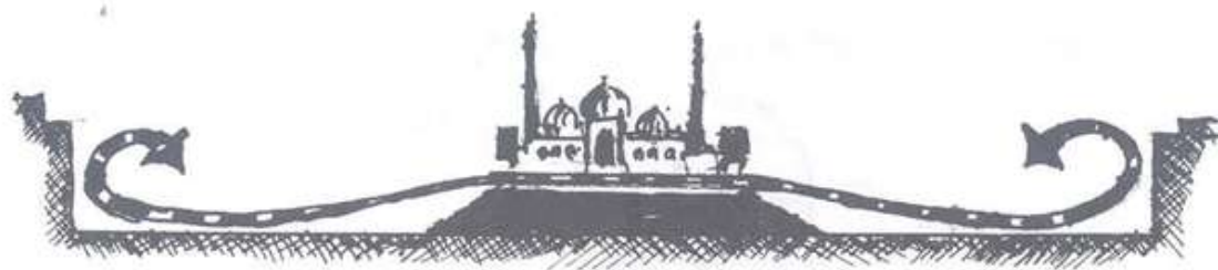
شکل ۳ فضای مسجد به عنوان فضای شهری

مساجد در ایران از دیرباز نقشی مهم در زمینه‌های اجتماعی و اقتصادی و سیاسی و کالبدی ایفا نموده‌اند. مساجد از یک سو محل برگزاری مراسم عبادی بوده‌اند و از سوی دیگر مکانی که زندگی اجتماعی ساکنان محلات را ساماندهی می‌کرده و به رتق و فتق امور مردم می‌پرداخته‌اند. مساجد همواره محل برقراری ارتباطات اجتماعی در سطح محلات و شهرها بودند. بسیاری از کنش‌های اجتماعی و اقتصادی مردم نظیر آموزش ۱۹ و حل و فصل دعاوی، رفع مشکلات اجتماعی و حل مسائل اقتصادی در درون مساجد صورت می‌گرفت. حتی مساجد در زمینه امور سیاسی همواره به عنوان اهرم‌های کنترل و نظارت بر حاکمان سیاسی جامعه عمل می‌کرده‌اند. ۲۰ به این ترتیب می‌توان گفت مسجد در جامعه ایرانی در ابعاد مختلف اجتماعی، سیاسی و کالبدی تاثیرگذار بوده است. ۲۱