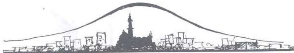
متحنی ارزش زمین در شاه جهان آباد

مرور زمان به گونه‌ای خاص و پر اهمیت شد که در مقاطعی از تاریخ در شهرهای اسلامی مسجد (به ویژه مساجد جامع) عنصر مهم در طرح و پلان اصلی شهر محسوب می‌شد و شریان‌های مهم شهری به طرف فضای مسجد و ورودی‌های آن جریان می‌یافت. وجود مسجد در شهر و محله به آن اعتبار کالبدی و اجتماعی می‌داد به نوعی که همین امر موجب افزایش میزان ارزش زمین‌های مجاور مسجد در گذشته می‌شد. ۲۵