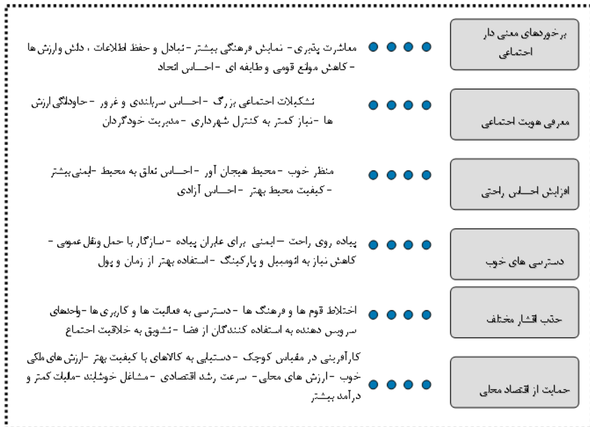
شکل (۲) معیارهای مؤسسه pps برای افزایش کیفیت محیط شهرها (سایت pps.org)